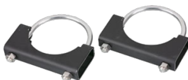
XGB-33 und XGB-53