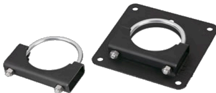
XGB-23 und XGB43